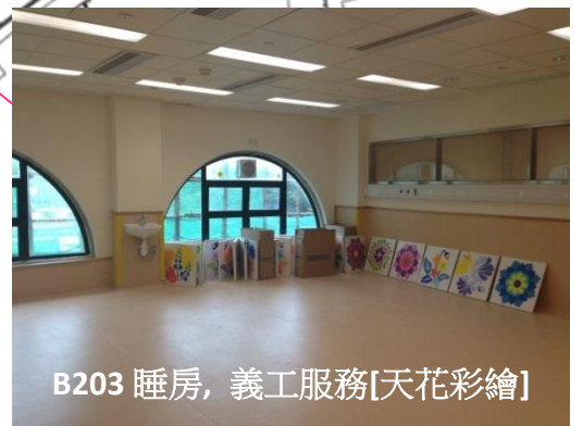
B203 睡房, 義工服務[天花彩繪]