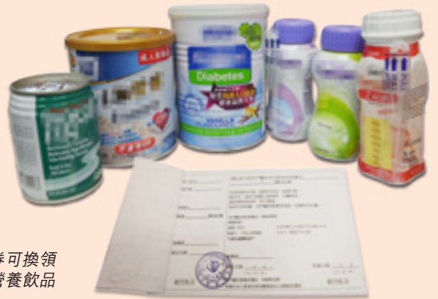
病人憑券可換領 所需的營養飲品