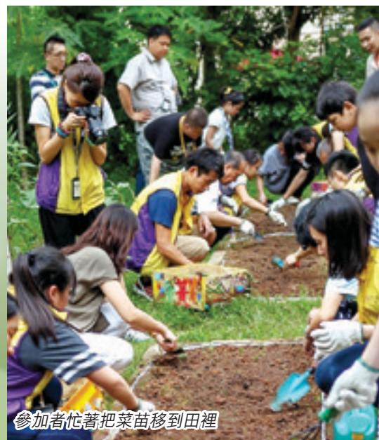
參加者忙著把菜苗移到田裡

為此，「陽光天使」和各個家庭協力撰寫一本日誌，記錄過程中的趣事和抒發感受，互勵互勉，共同留下美好回憶。