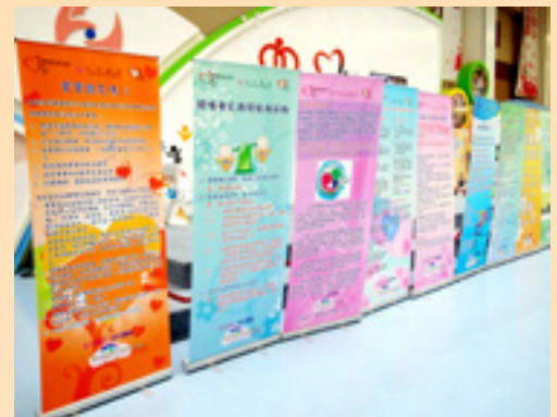
展覽提供詳細的母乳餵哺資訊，包括母乳的好處、餵哺技巧、常見謬誤及各種支援服務介紹。

世界母乳哺育行動聯盟(WABA)以保護、促進及支持母乳餵哺為宗旨，定出每年八月一日至七日為「國際母乳餵養週」。為響應二零一四年世界母乳餵養週，屯門醫院母乳餵哺推廣組舉辦一系列活動，包括母乳餵哺資訊巡迴展覽、攤位遊戲及致送紀念品予八月份在屯門醫院生產的產婦，讓公眾了解更多母乳餵哺的好處。