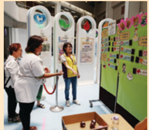
「母乳餵哺推廣活動」攤位遊戲