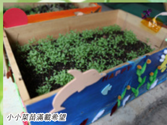
小小菜苗滿載希望