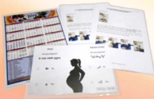
聯網設計了多種語言 回應提示卡

若要了解少數族裔病人的病情，與他們溝通尤其重要。聯網主要透過非政府機構為少數族裔病人提供免費傳譯服務，有關傳譯員均已接受培訓，亦會使用其他組織，如兼職法庭傳譯員、義工及領事館等提供的傳譯服務。聯網現時可以提供十九種語言的傳譯服務、以多種語言撰寫的回應提示卡、病人同意書和疾病資料單張等，並於醫院內張貼有關海報，鼓勵少數族裔病人善用服務。