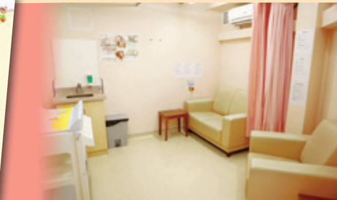
屯門醫院於C7、D6及D7病房均設有母乳餵哺室，而訪客則可使用分別設於屯門醫院主座及博愛醫院地下大堂的母乳餵哺育嬰室，房間設施齊備、環境舒適，獲得使用者讚許(左圖)。