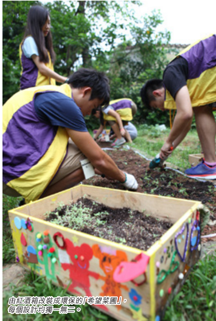
由紅酒箱改裝成環保的「希望菜園」，每個設計均獨一無二。