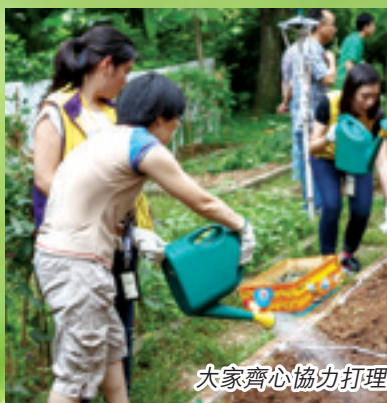
大家齊心協力打理「希望農莊」