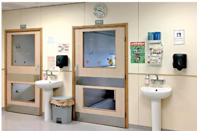
■為了減少醫院人流及院內交叉感染風險，現時精神科病房只會安排緊急及病情較為不穩的病人入院。