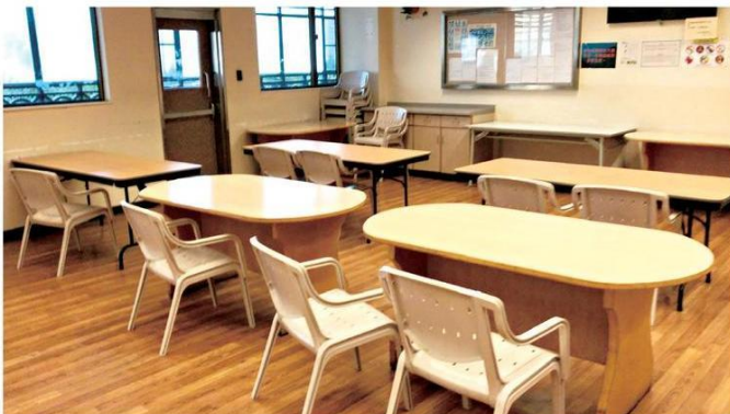
■醫院會為病人安排單方向座位或在床邊進食，減低他們因面對面飛沫傳播而受感染的機會。