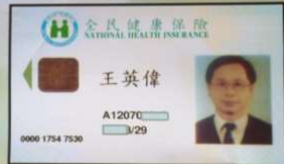
Advance Directive recorded in the NHI card